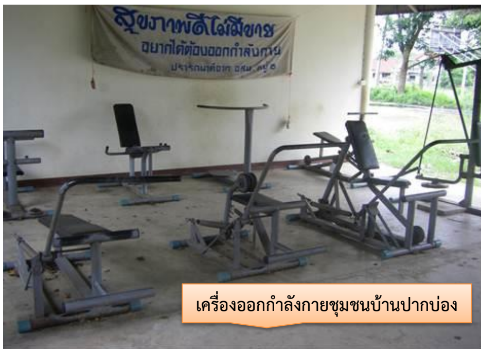
เครื่องออกกำลังกายชุมชนบ้านปากบ่อง