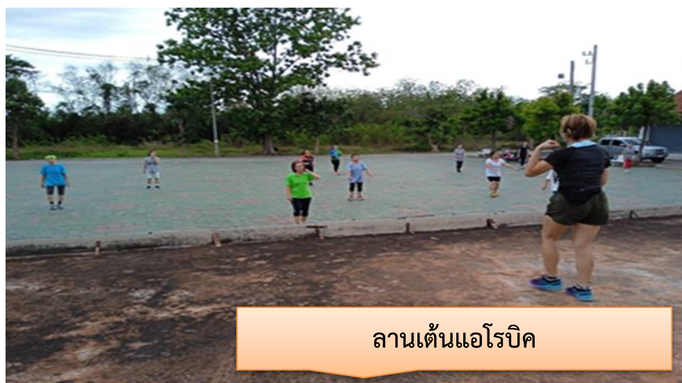
ลานเดินแอโรบิก