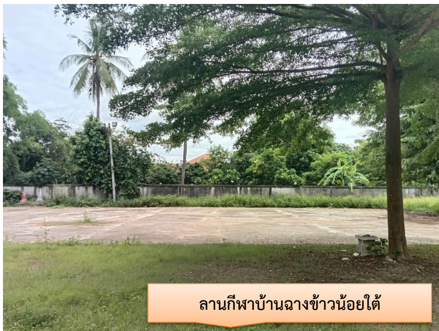
ลานกีฬาบ้านฉางข้าวน้อยใต้