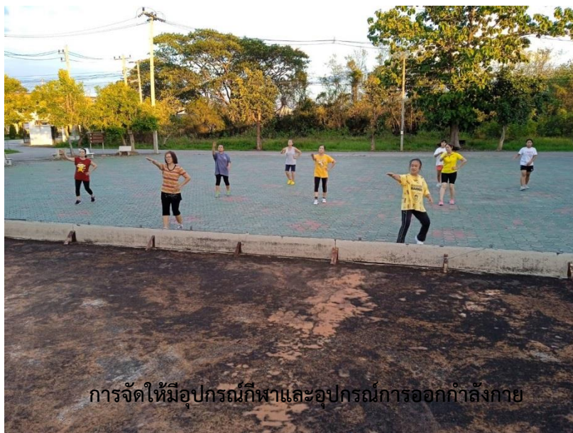
การจัดให้มีอุปกรณ์กีฬาและอุปกรณ์การออกกำลังกาย