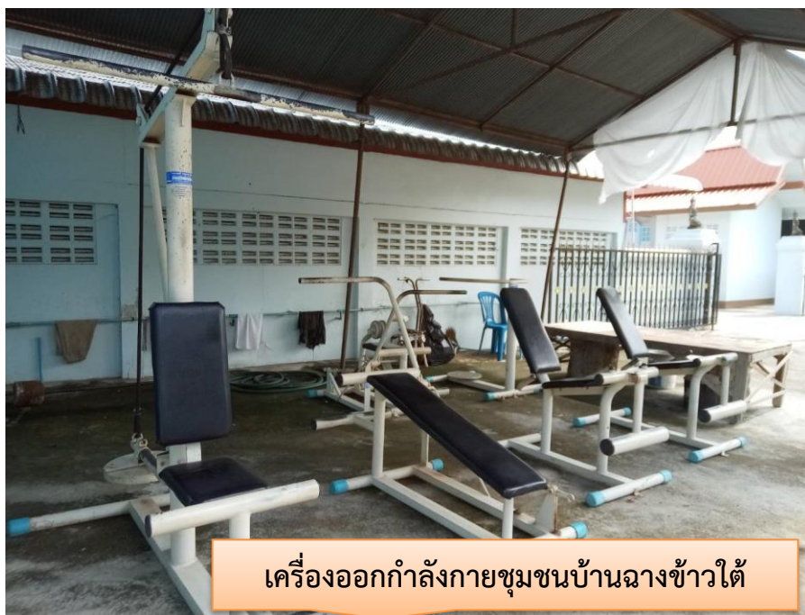
เครื่องออกกำลังกายชุมชนบ้านฉางข้าวน้อยใต้