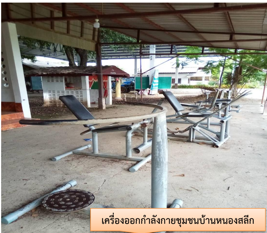
เครื่องออกกำลังกายชุมชนบ้านหนองสลิก