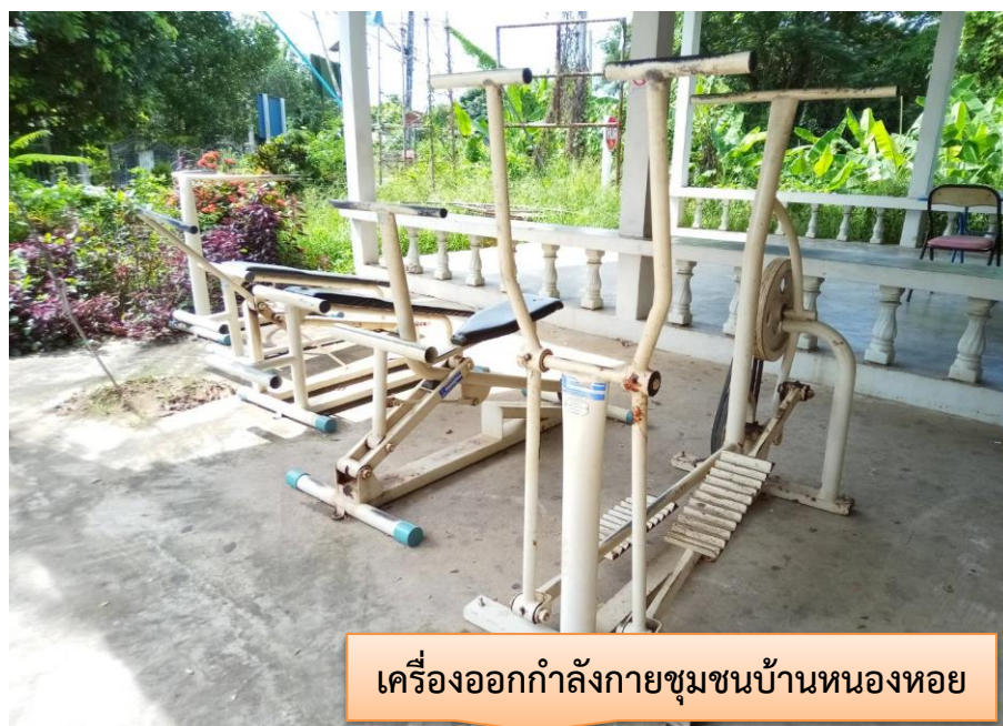
เครื่องออกกำลังกายชุมชนบ้านหนองหอย