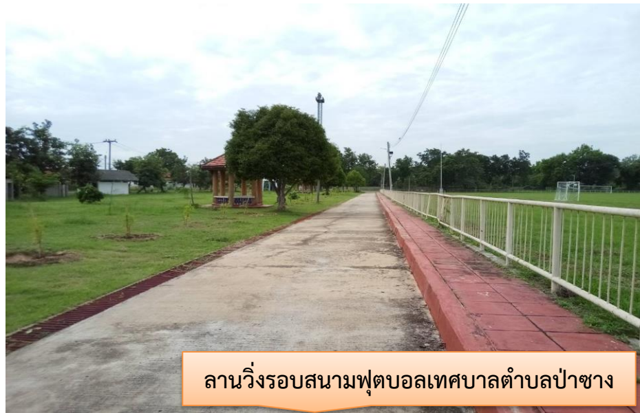
ลานวิ่งรอบสนามฟุตบอลเทศบาลตำบลป่าซาง