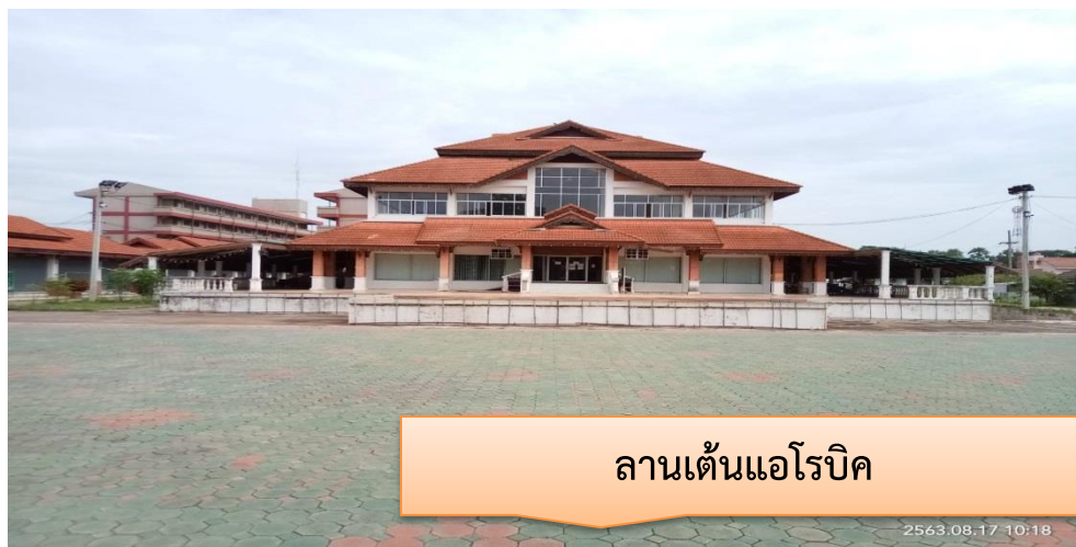
ลานเดินแอโรบิก