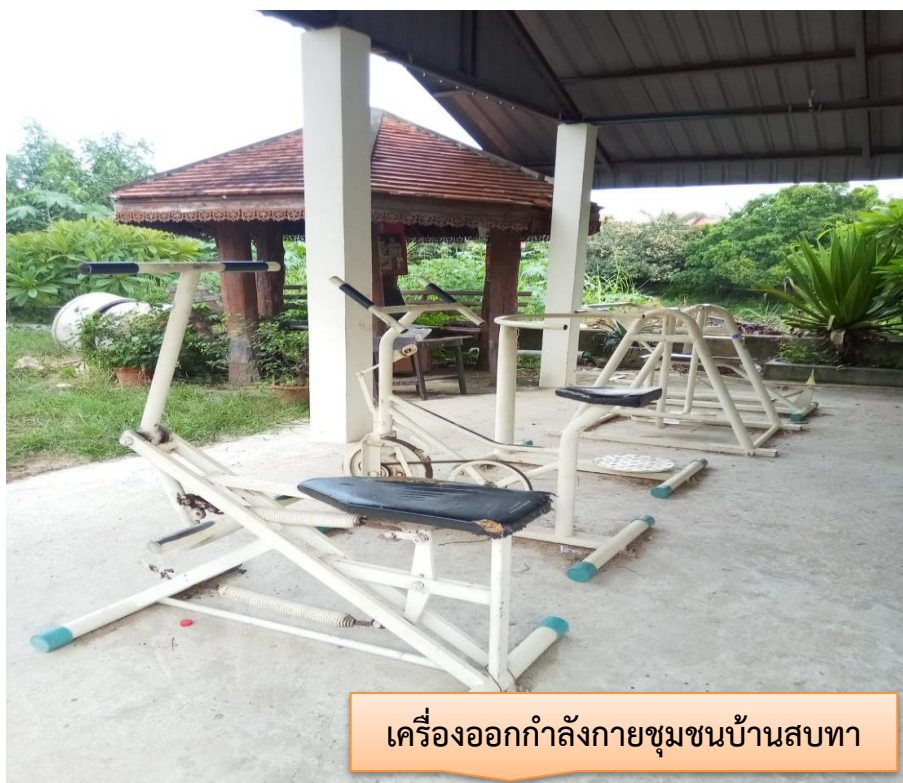
เครื่องออกกำลังกายชุมชนบ้านสบทา