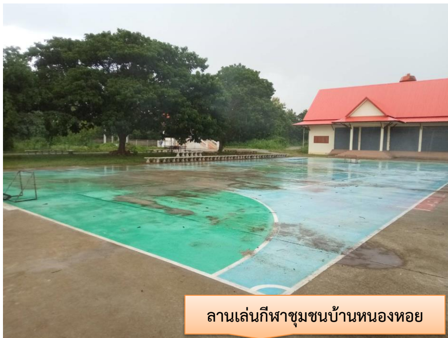
ลานเล่นกีฬาชุมชนบ้านหนองหอย