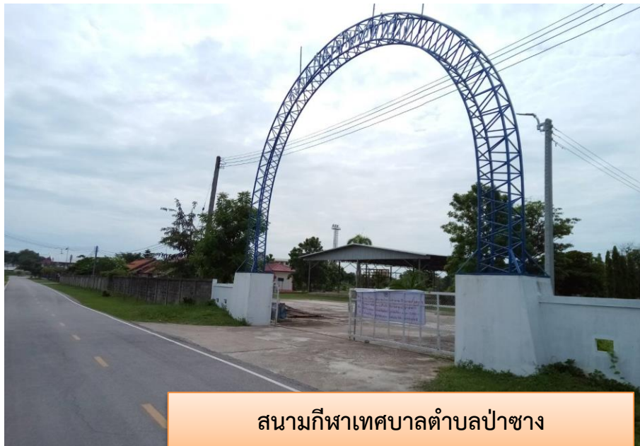
สนามกีฬาเทศบาลตำบลป่าซาง

๑. สนามกีฬากลางเทศบาลตำบลป่าซาง / ลานกีฬาบ้านป่าซาง