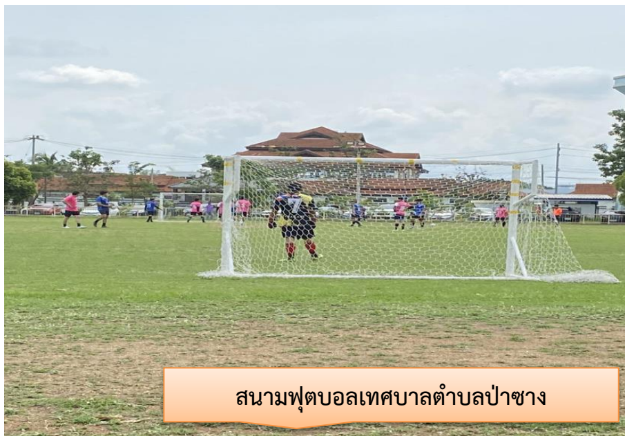
สนามฟุตบอลเทศบาลตำบลป่าซาง