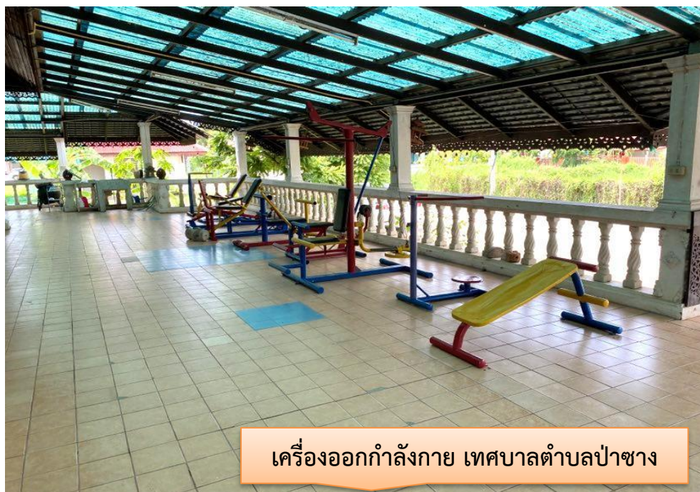
เครื่องออกกำลังกาย เทศบาลตำบลป่าซาง