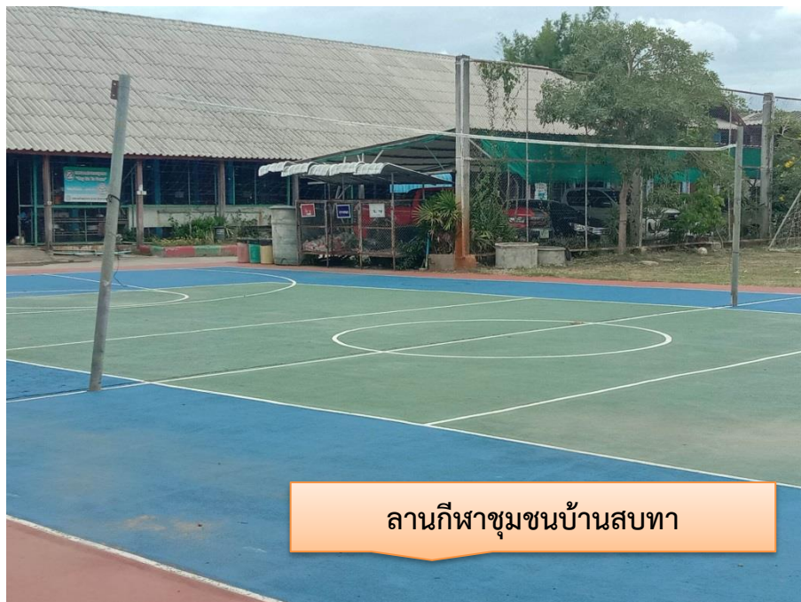
ลานกีฬาชุมชนบ้านสบทา