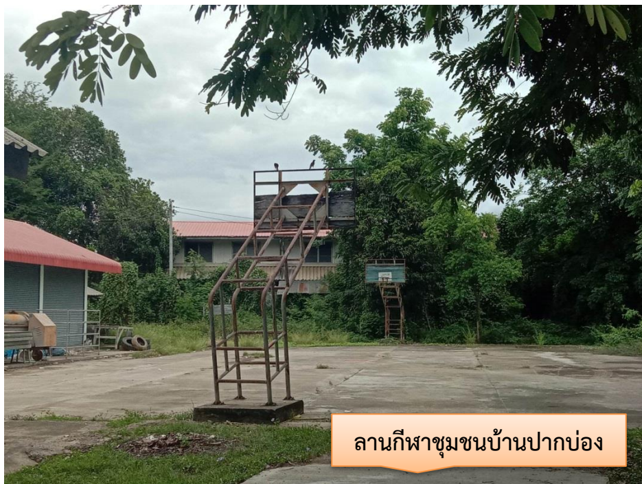
ลานกีฬาชุมชนบ้านปากบ่อง