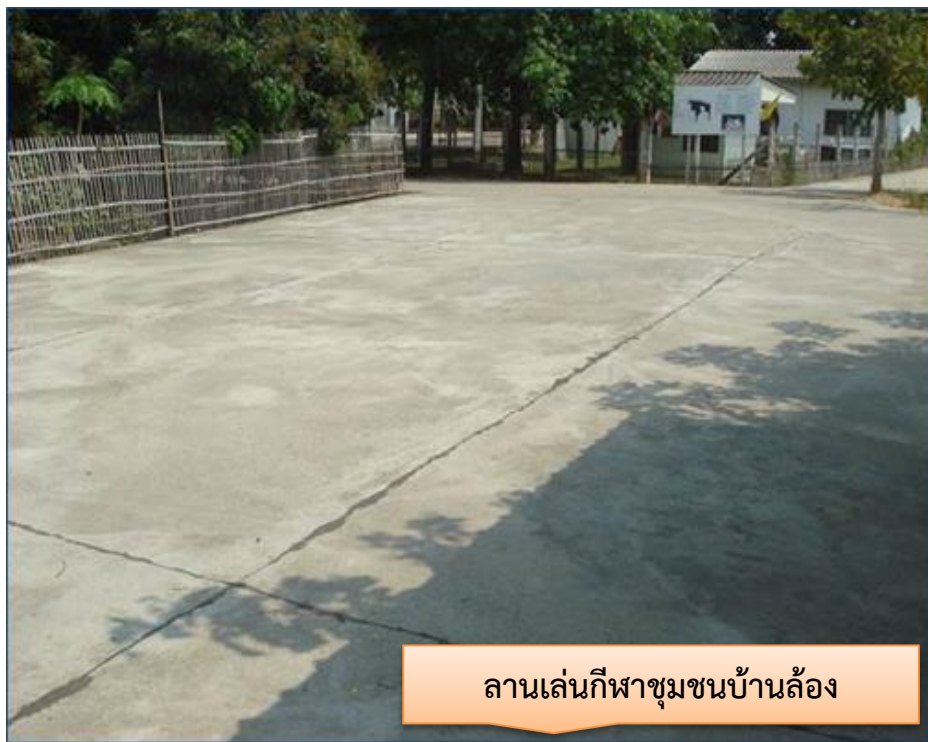
ลานเล่นกีฬาชุมชนบ้านล้อง