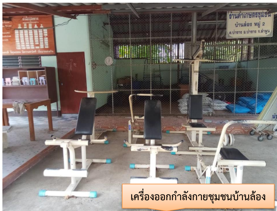
เครื่องออกกำลังกายชุมชนบ้านล้อง