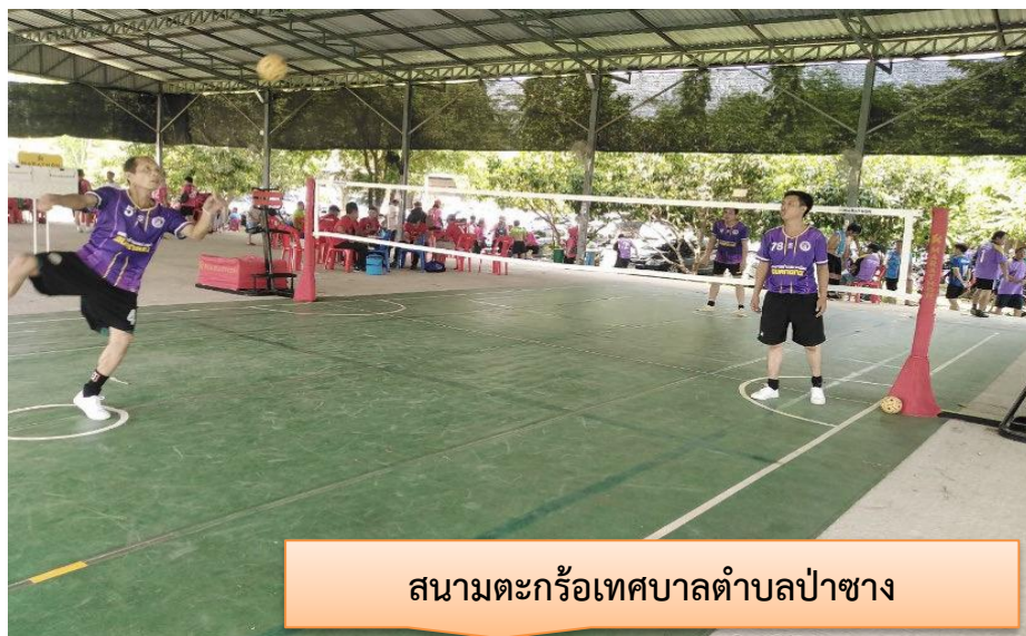
สนามตะกร้อเทศบาลตำบลป่าซาง