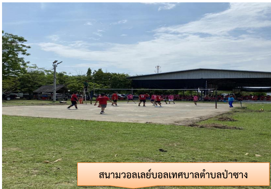
สนามวอลเลย์บอลเทศบาลตำบลป่าซาง