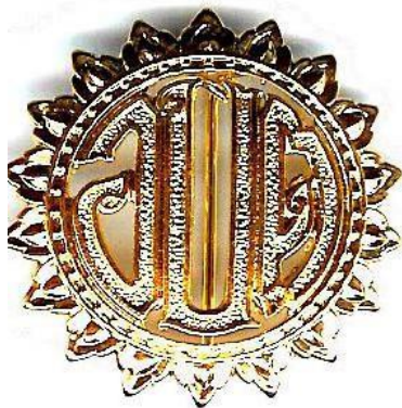
องค์การบริหารส่วนตำบล